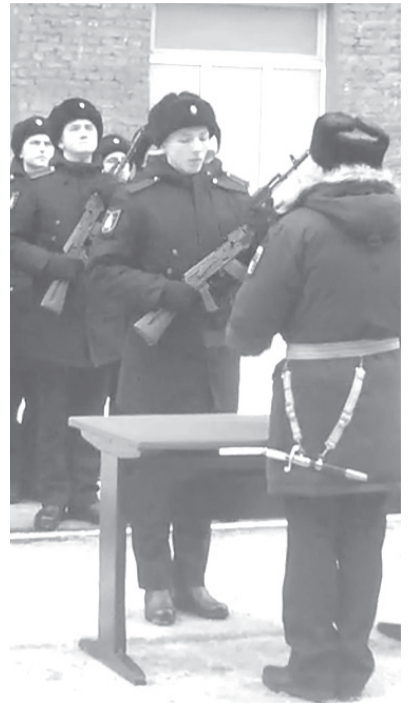
Присягу принимают морские пехотинцы. С.-Петербург, февраль 2019 г.

Вот опять проявляя отвагу, В череде беспокойнейших дней, Сыновья принимают присягу На служенье Отчизне своей. В небесах, на земле, иль на море, – Где бы ни довелось им служить, Им Отечество наше родное От врагов защищать и хранить. И каким бы ни стало служенье, Слово данное надо держать, Всё новейшее вооруженье Нужно будет освоить, узнать. Но ребята, конечно же, знают: Службу – с честью нести до конца, Что их дома всегда ожидают С нетерпением родные сердца.