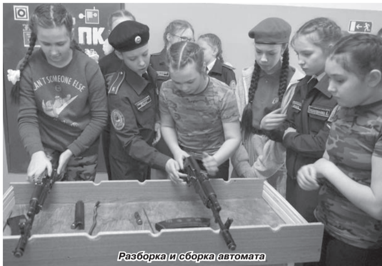
Разборка и сборка автомата

В Марковской школе имени полного кавалера ордена Славы И.В.Дубова прошёл районный сбор юнармейских отрядов, посвященный 30-летию вывода советских войск из Афганистана.